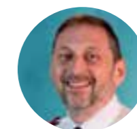
Tenente-Coronel Nick Coke Secretário de Comunicação Território do Reino Unido e Irlanda

Paulo diz à igreja em Corinto: “Estejam vigilantes, mantenham-se firmes na fé, sejam homens de coragem, sejam fortes. Façam tudo com amor” (1 Coríntios 16:13-14). Não precisamos esperar para fazer isso. Já podemos adotar um tom amoroso nas redes sociais ou amplificar as vozes de outros que muitas vezes são ignorados. Já podemos tomar uma posição sobre como nos relacionamos com o uso da tecnologia de maneiras amáveis e amorosas. Já podemos modelar o chamado de Jesus na forma como falamos sobre as oportunidades e riscos da IA no futuro.