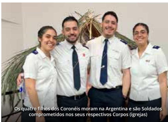
Os quatro filhos dos Coronéis moram na Argentina e são Soldados comprometidos nos seus respectivos Corpos (igrejas)

Aprendemos que não somos perfeitos e que precisamos continuar aprendendo de tudo e de todos. Estar