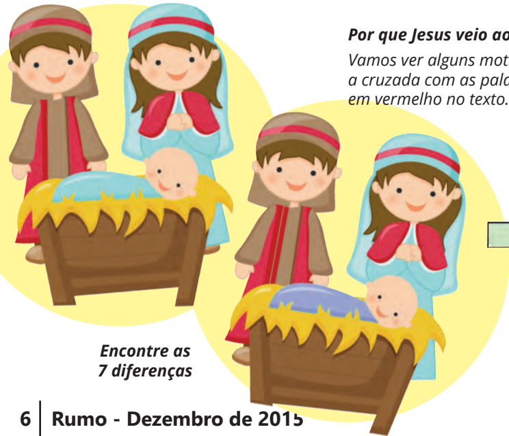
Encontre as 7 diferenças